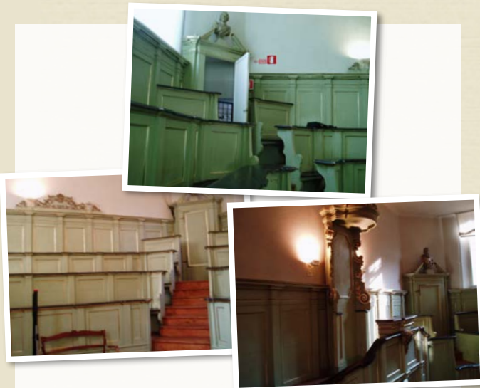
Immagini attuali del teatro Anatomico di Palazzo Paradiso

Cento anni di psicologia ferrarese, dalla scuola freniatria ferrarese fino ai giorni nostri, hanno disegnato una traiettoria varia e composita, con alterne vicende ma con una costante attenzione per la città ed i suoi grandi momenti scientifici, culturali, artistici. Nella rinnovata ed antica cornice del Teatro Anatomico si aprono dunque di nuovo, per il dodicesimo anno, le porte della Biblioteca Ariostea per proseguire con altre sei nuove tappe del percorso di un viaggio pieno di psicologia ed altre storie.